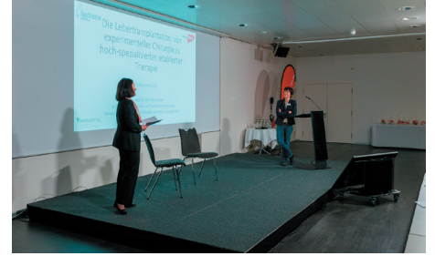
Beginn der ersten Referate