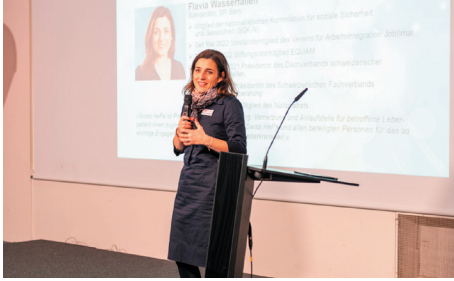
Grusswort von Ambassadorin Flavia Wasserfallen