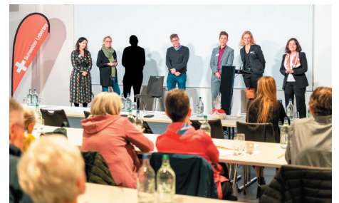
Patient:innen und Ärzte beantworten Fragen

Wir danken ganz herzlich folgenden Sponsoren für ihre aktive Unterstützung durch das ganze Jahr 2023!