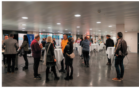
Eintreffen der Besucher:innen