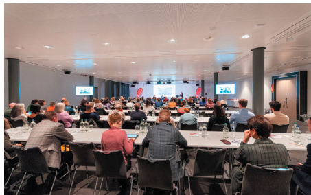
Gut besuchter Saal