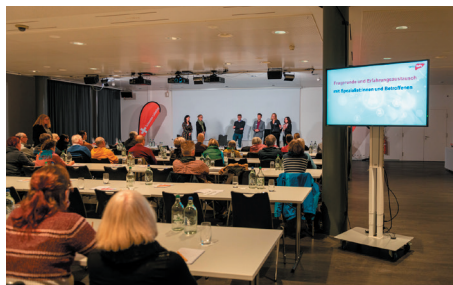
Fragerunde und Erfahrungsaustausch