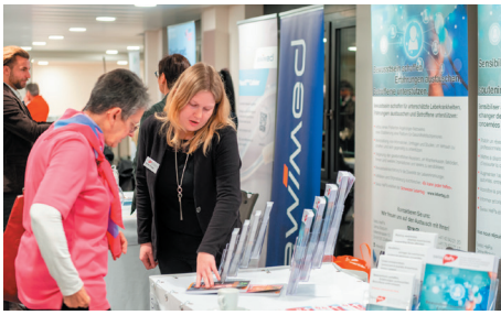
Forum mit Infoständen