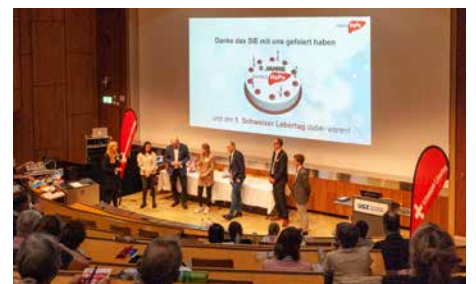
Ende des 1. Schweizer Lebertages

Wir danken ganz herzlich folgenden Sponsoren für ihre aktive Unterstützung durch das ganze Jahr 2022!