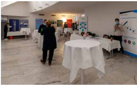
Foyer mit Sponsoren und Vereinen