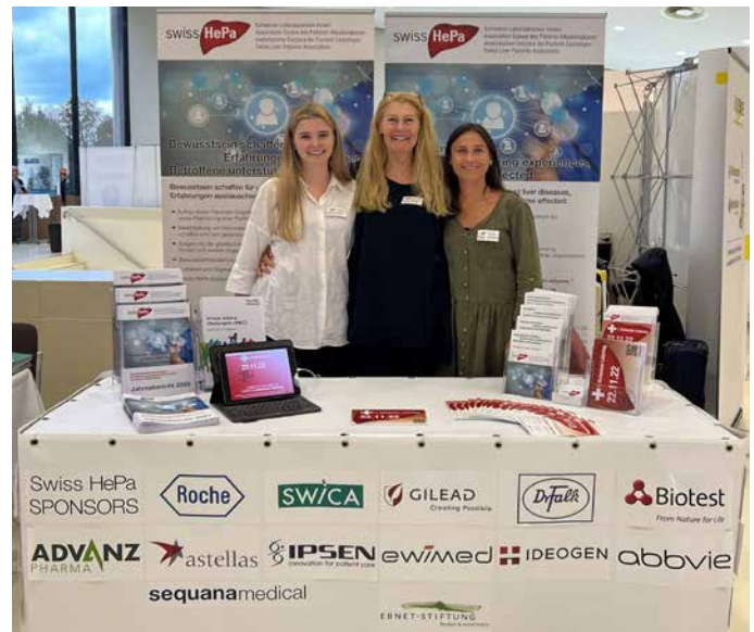
15.09.2022: Swiss HePa am SGG/SSG-Ärzte-Kongress

Die Patientenorganisation Swiss HePa durfte sich wieder mit einem repräsentativen Stand den vielen Besuchern am SGG-Jahreskongress vorstellen. Gastroenterologen, Hepatologen und Gesundheitsfachpersonen aus der ganzen Schweiz fanden sich ein, um den verschiedenen Veranstaltungen und den fachkundigen Programmen beizuwohnen. Wir konnten durch unsere Präsenz die Aufmerksamkeit der Ärzteschaft und der Pharmaindustrie erfolgreich auf uns lenken und die nationale Bedeutung des Leberpatienten Vereins Swiss HePa als Schnittstelle, Netzwerk und Stimme für alle Betroffenen von Lebererkrankungen und ihre Angehörigen aufzeigen.