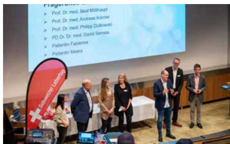
Fragerunde und Erfahrungsaustausch