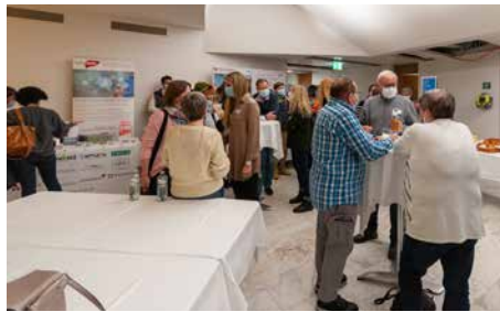
Eintreffen der Besucher mit Apéro