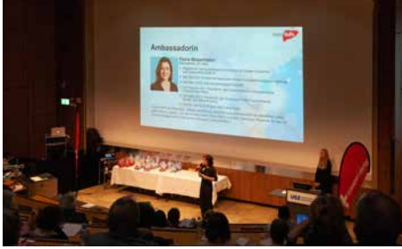
Grusswort von Ambassadorin Flavia Wasserfallen