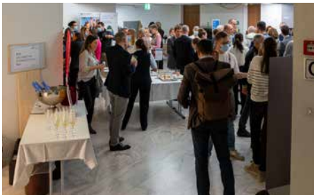
Apéro riche und Besuch der Infostände